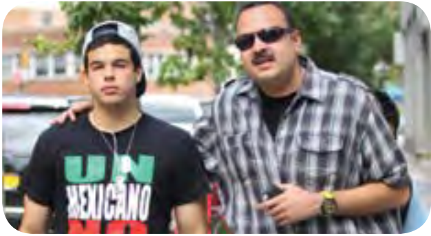
Mi hijo deberá ser juzgado conforme a la ley: Pepe Aguilar