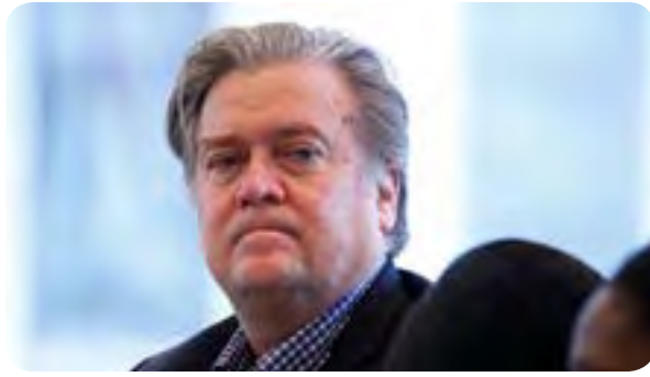
Stephen Bannon sale del Consejo de Seguridad de EE. UU.