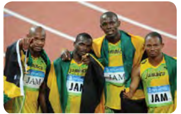
COI habria ocultado dopaje de atletas jamaicanos en Pekin 2008... Pág. 12