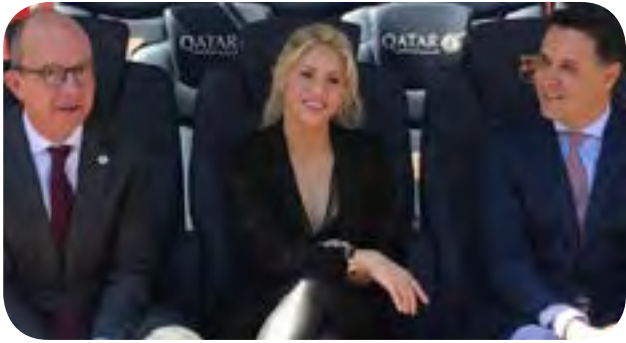
Shakira y el FC Barcelona construirán un nuevo colegio en Barranquilla