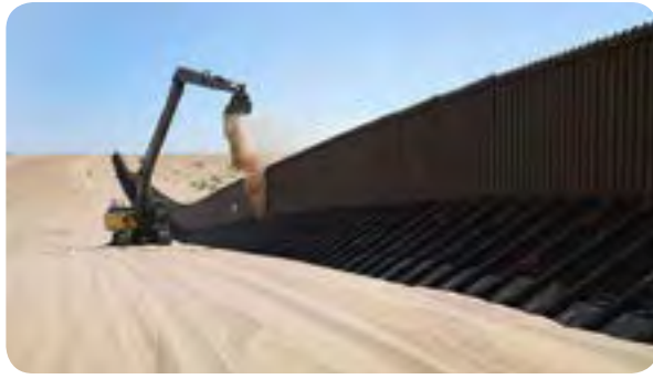
Congreso de EEUU no aprobará dinero para el muro tan rápido como quiere Trump Pág. 4